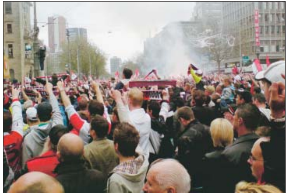
De Coolsingel eindelijk weer vol!