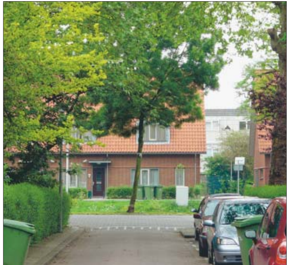
Vreewijk, een groene oase op Zuid.

Sonneveld trachtte daarom zelf middels een nieuw voorstel in de gemeenteraad te voorkomen dat er woningen worden gesloopt voordat nieuw onderzoek van TNO aantoonde dat woningen verder verzakken. Als dit niet het geval is, zou er al helemaal niet gesloopt moeten worden. Ook deze motie behaalde geen meerderheid, waardoor Sonneveld sceptisch blijft over de toekomst van Vreewijk. Leefbaar Rotterdam blijft de situatie kritisch volgen.