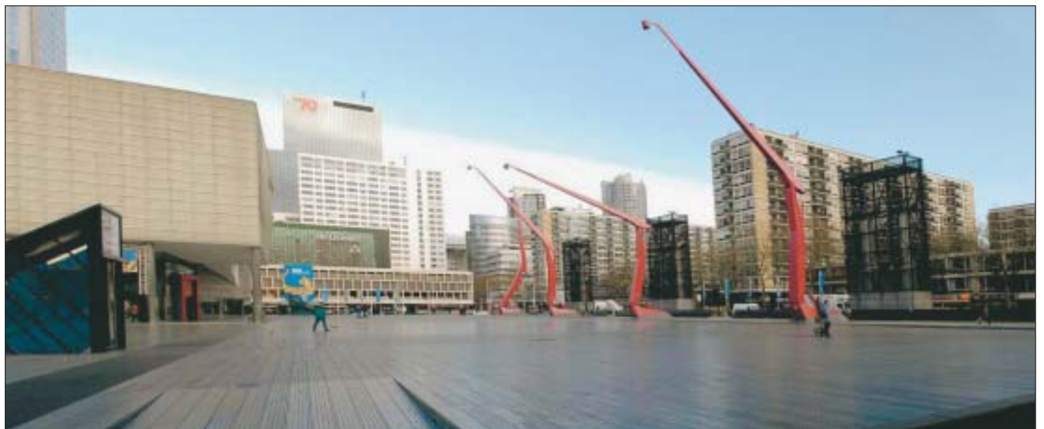
Het Schouwburgplein; even gezellig en knus als het Rode Plein in Moskou.

Het was voor Van der Hilst reden om het Schouwburgplein op de politieke agenda te zetten. Hij analyseerde de problemen waar het plein mee te kampen heeft, bekeek waar de kansen liggen en kwam tot een aantal aanbevelingen om het plein meer te laten bruisen. Zo stelde hij voor horecamogelijkheden rond het plein te verbeteren