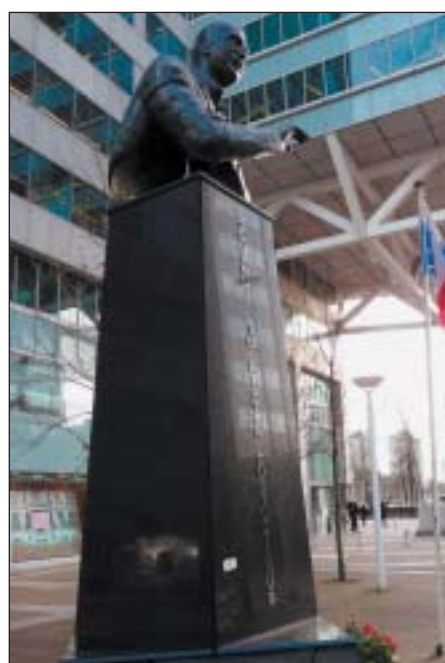
Het standbeeld van Pim Fortuyn op de Korte Hoogstraat met op de sokkel het opschrift: 'Waakt over de vrijheid van het spreken'.

Om met Voltaire te spreken: "Ik kan uw mening nog zo abject vinden, maar ik zal uw recht verdedigen die te uiten!" Dat dient ook voor de Koran op te gaan. We gaan ons niet verlagen tot het niveau van Taliban en consorten.