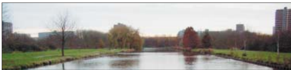
De kanovijver in het Ommoordseveld.

De fractie van Leefbaar Rotterdam kan zich niet vinden in het voornemen van het college om woningbouw op het Ommoordse Veld mogelijk te maken. In de stadsvisie 2030 staat dit stukje natuur nu gemarkeerd als gebied waar 'sterke woonmilieus uitgebouwd moeten kunnen worden.'