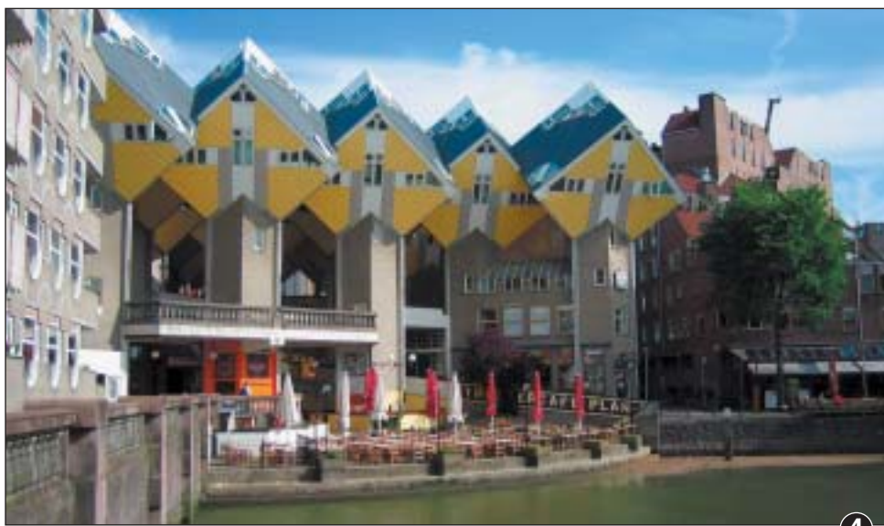
De gezellige Oude Haven en de kubuswoningen. Toeristische attractie of gevangenis? 4