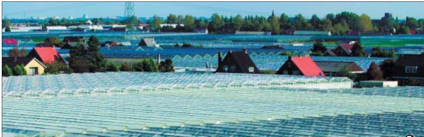
CO 2 is goed voor planten en bomen. Daarom spuiten de tuinders in het Westland ook extra CO 2 in de kassen.

Een groot bezwaar van Leefbaar Rotterdam is dat er voor dit initiatief geen samenwerking wordt gezocht met de Stadsregio. Een gemiste kans. De kosten van het RCI worden op deze wijze slechts afgewenteld op de, in verhouding tot de rest van de regio, al minder draagkrachtige Rotterdamse burgers. Daarnaast zal het effect van de CO 2 reductie ook nog eens veel minder effect hebben, omdat omliggende gemeenten niet mee doen.