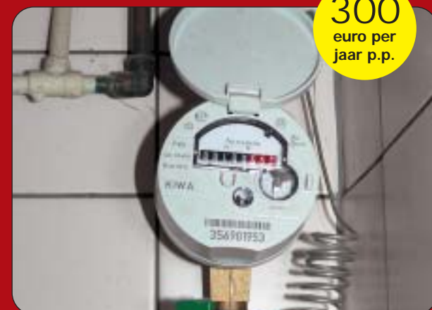
Rioolbelasting & Onroerende Zakenbelasting (OZB)