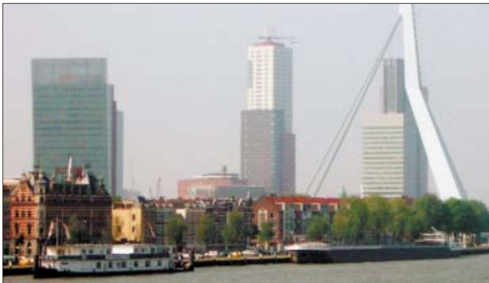
Zicht op het Noordereiland.

Ik hoop uit de grond van mijn hart dat de overheid nu op tijd is geïnformeerd, op tijd ingrijpt en de juiste dingen gaat doen. Dat laatste is niet het sterkste punt van dit college. Het eerste is nu geregeld. De strijd is niet voor niets gevoerd.