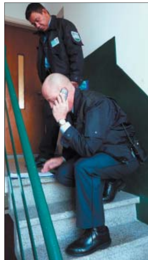
Een interventieteam staat klaar om een woning te gaan controleren. Het zijn de interventieteams die illegale bewoning door Polen en andere Oost-Europeanen moeten opsporen.

Een motie die het wel haalde, had betrekking op het controleren van de woonadressen van die Oost-Europeanen die nog wel een werkvergunning aan moeten vragen om in Nederland te kunnen werken. Het gaat dan vooral om Roeme-