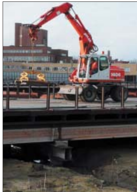
Na 1½ jaar stilstand mag aannemer Strukton het nog een keer proberen.