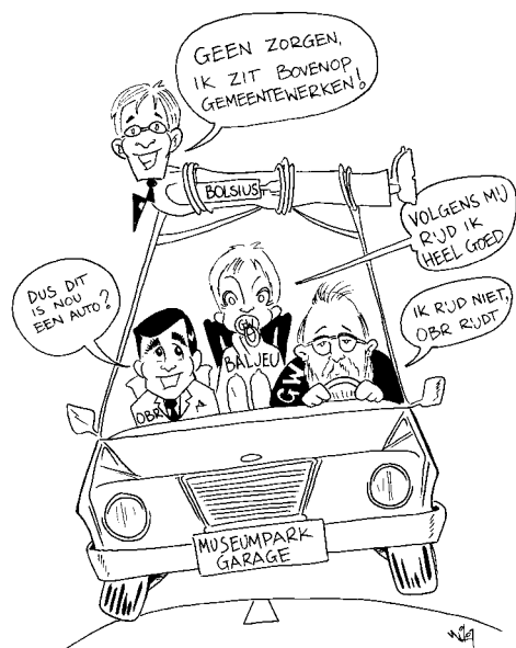
De bestuurlijke sturing op het Museum-parkgarage project.