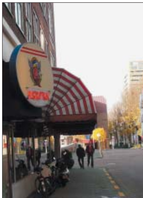
Coffeshop de Reefer.

Als u zelf geen softdrugs gebruikt is er een grote kans dat u dit prima beleid vindt. U heeft er dan immers geen last van. Maar ondanks dat Leefbaar Rotterdam geen drugs gebruikt, zitten we er toch wat genuanceerder in. Vrijheid is een belangrijk goed voor Leefbaar Rotterdam. Mensen hebben het recht hun leven zo in te richten als ze dat zelf willen en ze hebben ook het recht genotmiddelen te gebruiken.